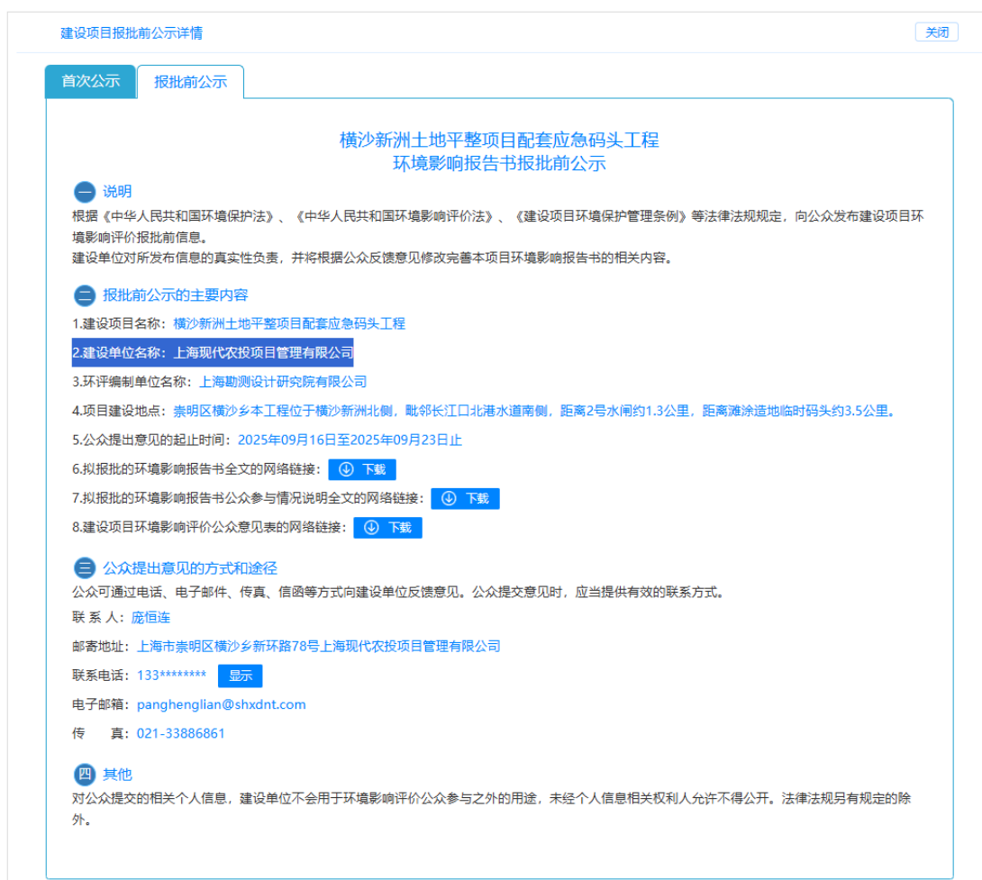
图6 报批前公示的网络截图

设单位于2025年9月16日~2025年9月23日通过网络对本工程环境影响报告书全文和公众参与说明进行了公示。报批前公示在上海企事业单位环境信息公开平台开展（ https://e2.sthj.sh.gov.cn:8081/jsp/view/hjxxgk/index.jsp ）。建设单位通过网络公开下列信息：（一）环境影响报告书全文；（二）公众参与说明，公开情况符合《环境影响评价公众参与办法》的相关要求。公示截图见图6。