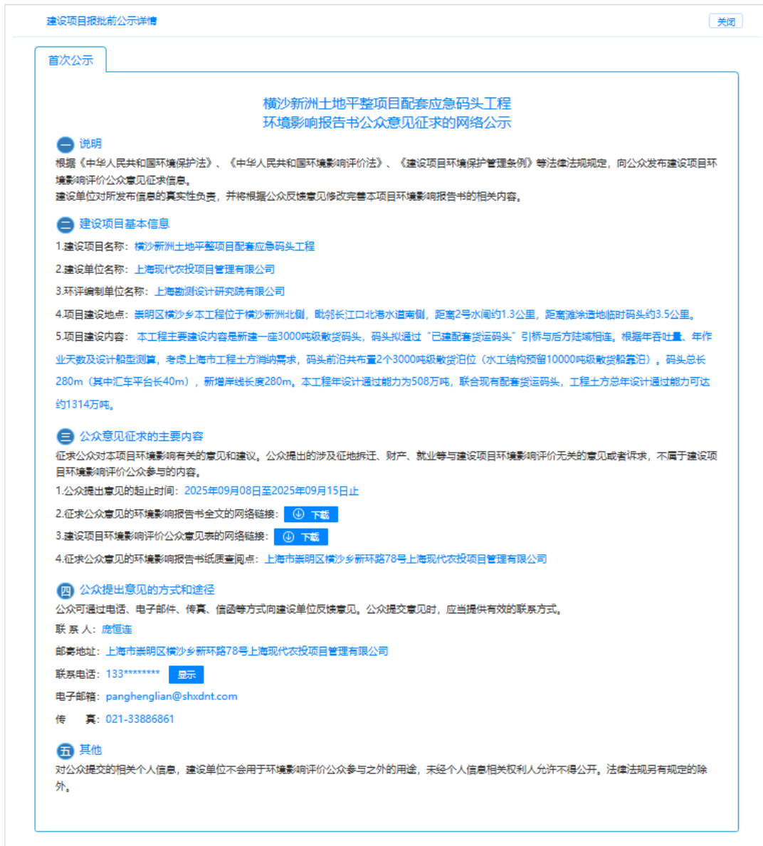
图 1 征求意见稿公示截图

本项目征求意见稿公示采取网络公开方式的载体为上海企事业单位环境信息公开平台（ https://e2.sthj.sh.gov.cn/jsp/view/hjxxgk/index.jsp ），网络公示方式符合《环境影响评价公众参与办法》中“通过网络平台公开，且持续公开期限不得少于5个工作日”的相关要求。