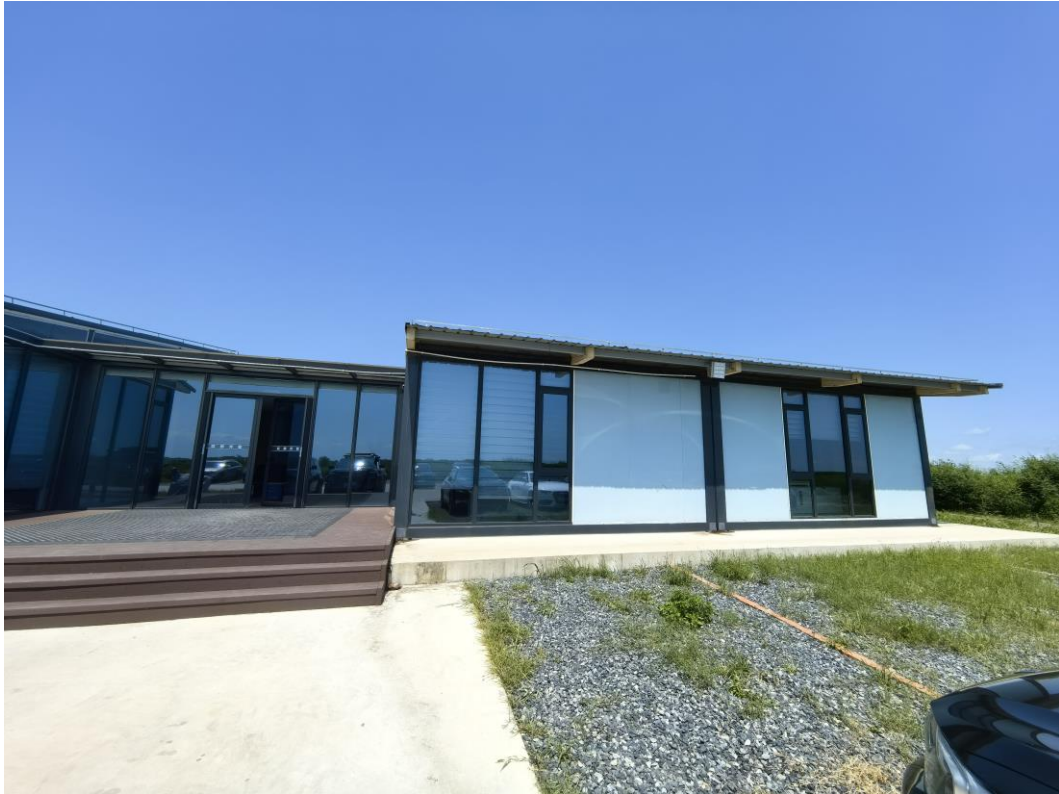
图5 环评报告现场查阅场所