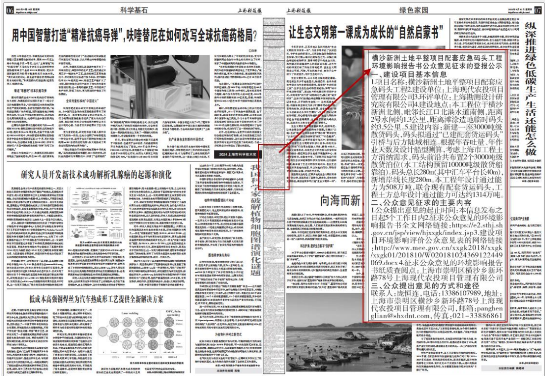
图 4 2025 年 9 月 10 日报纸公示截图

本项目征求意见稿公示采取报纸公示方式的载体为市级刊物，载体选取符合《环境影响评价公众参与办法》中“通过建设项目所在地公众易于接触的报纸公开”的相关要求。