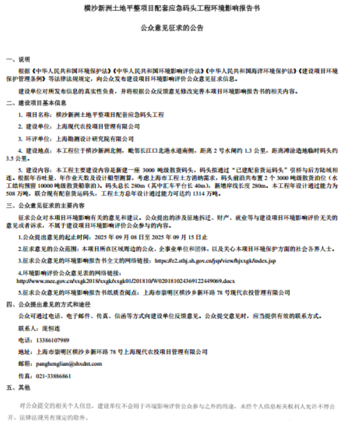
图 2 征求意见稿公告信息

张贴区域选取各敏感点附近醒目位置，均为公众易于知悉的场所，张贴区域选取符合《环境影响评价公众参与办法》中“通过在建设项目所在地公众易于知悉的场所张贴公告的方式公开”的相关要求。