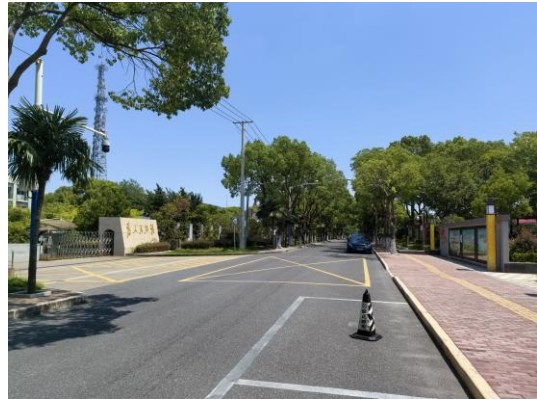
横沙乡政府现场公示